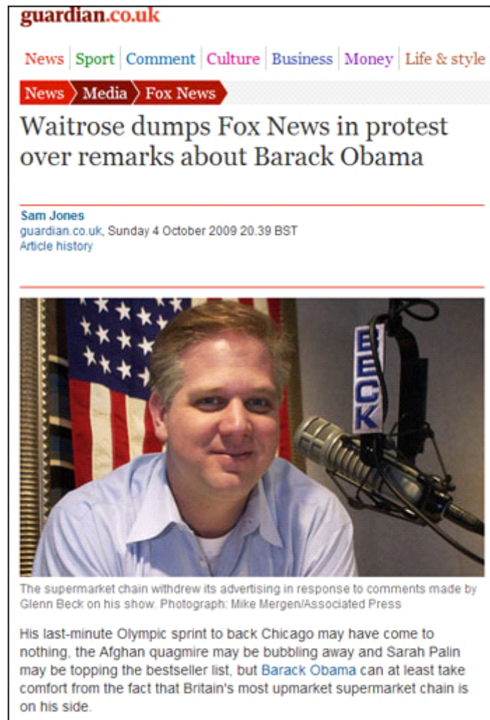
▲ 웨이트로즈의 폭스뉴스 광고철회에 대한 영국매체 가디언의 보도

2009년 7월 자신의 집에 들어가려는 흑인 교수를 체포한 백인 경찰을 두고 오바마 미국 대통령은 "어리석게 행동했다"고 비판했습니다. 이 발언을 두고 경찰들이 반발하는 등 논란이 확산되자 오바마는 자신의 발언을 사과하며 해당 경찰과 교수를 백악관에 불러 맥주 파티를 벌이기도 했는데, 폭스뉴스의 토크쇼 진행자인 글렌 벡은 방송에서 "오바마 대통령은 백인과 백인 문화에 대해 뿌리깊은 증오를 갖고 있는 인종주의자"라고 말합니다.